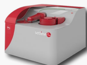
-170°C à +700°C