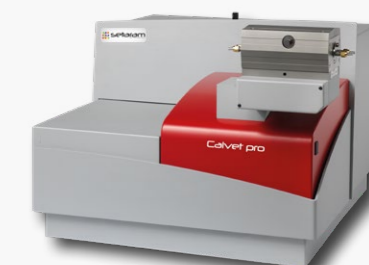
-120°C à + 830°C