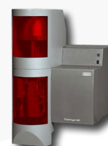
Température ambiante à 1750°C