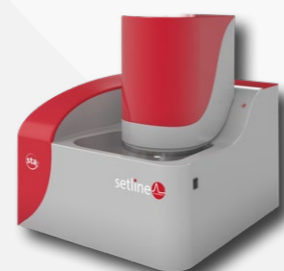
Température ambiante à 1100°C