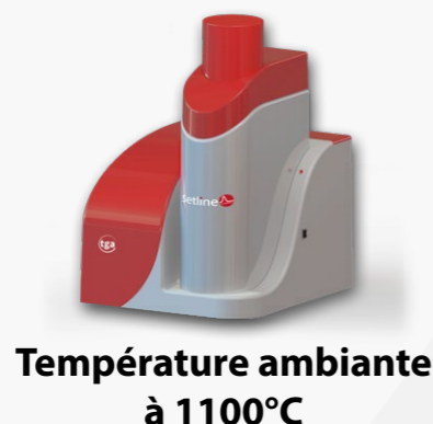
Température ambiante à 1100°C