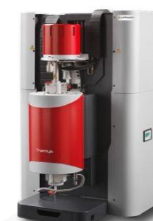
Température ambiante à 2400°C Système haute pression disponible