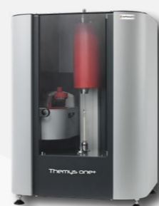
Température ambiante à 1600°C