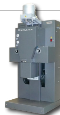
Température ambiante à 1750°C