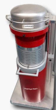
Température ambiante à 1200°C